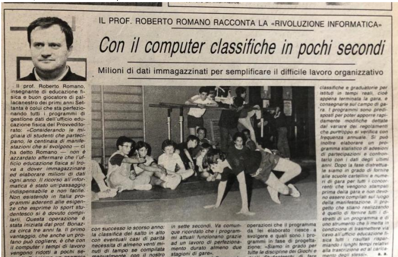
Articolo Giornale di Brescia del 1985

La primissima versione che ho prodotto è nata nel 1983 ancora in ambiente DOS e dopo vari test effettuati presso l'Ufficio di Educazione Fisica e Sportiva del Provveditorato agli Studi di Brescia di dove, in distacco annuale, lavoravo è divenuta operativa dal 1985.